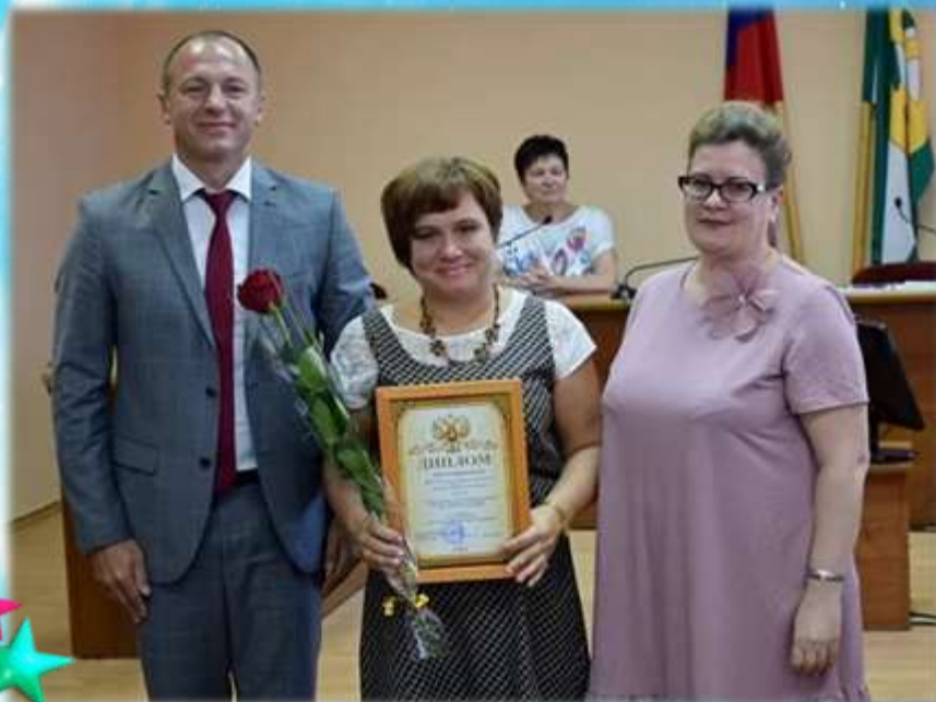
Награждение за победу в конкурсе «Лучшая территория дошкольного учреждения»