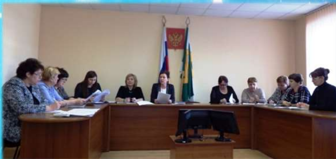
Заседание трёхсторонней отраслевой комиссии