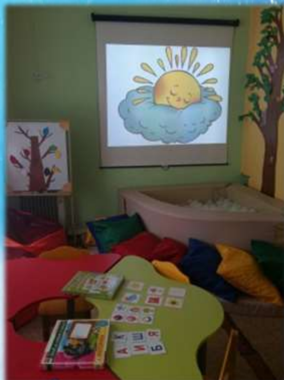
Кабинет педагога - психолога