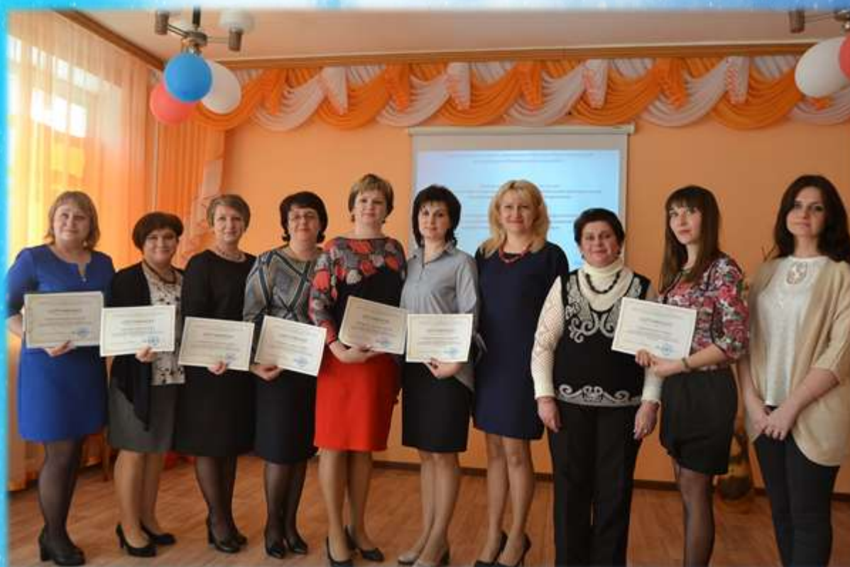
Выступление педагогов на областном семинаре в рамках базовой площадки Института повышения квалификации г.Тула по проблеме «Организация образовательного процесса в ДОО, направленное на познавательное и речевое развитие детей с ограниченными возможностями здоровья»