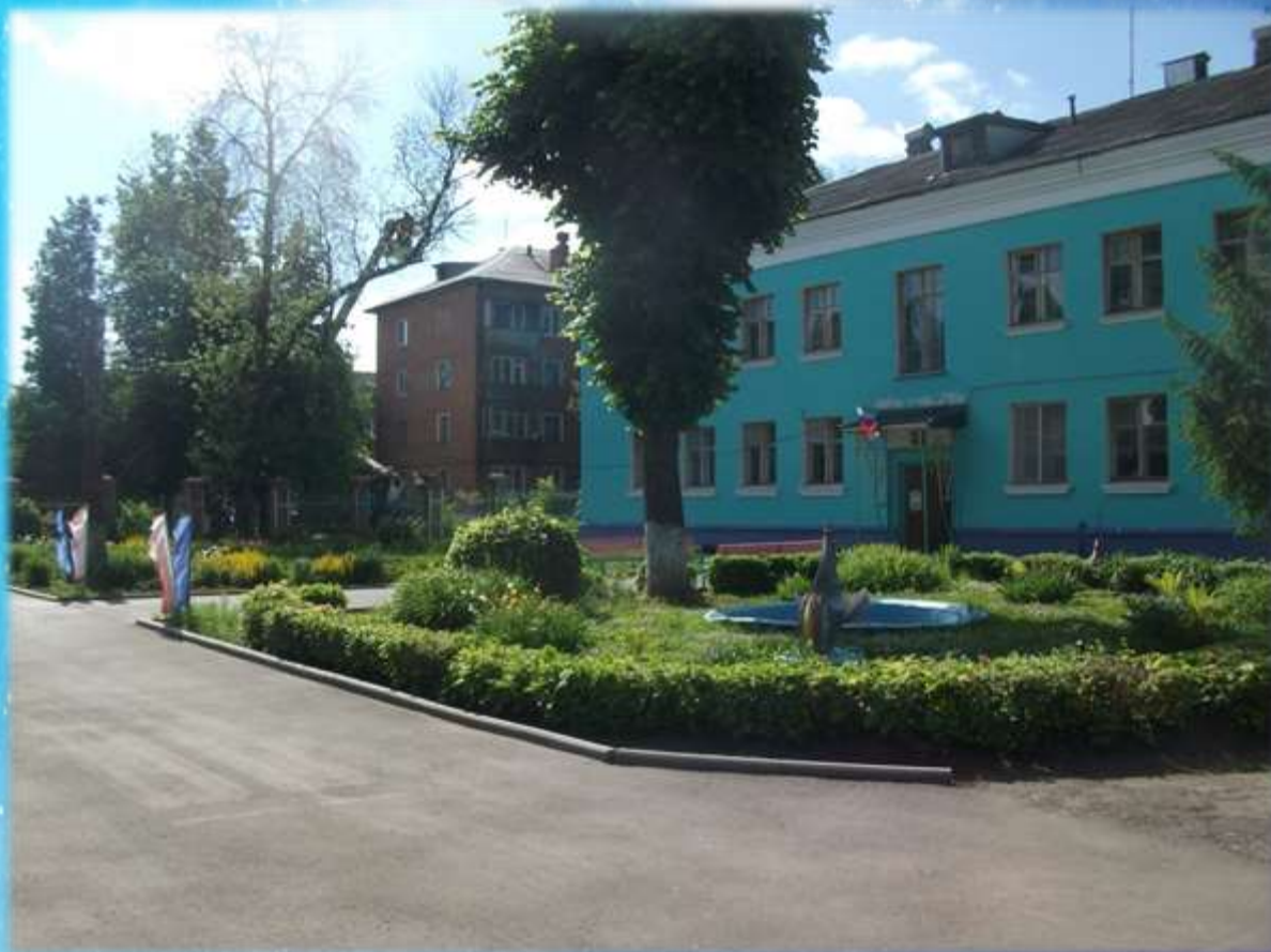
Здание второго корпуса после ремонта фасада