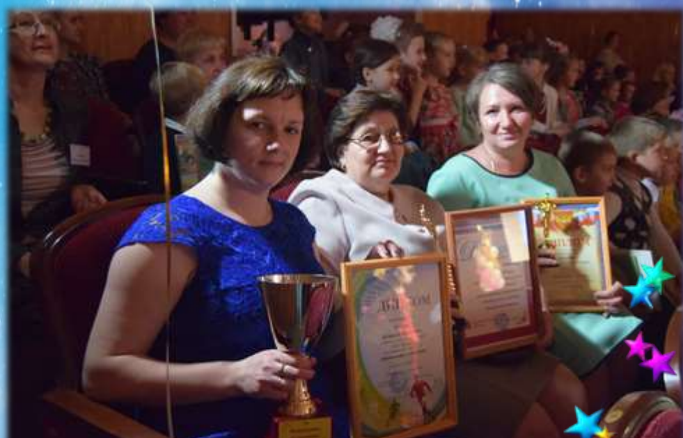
Награждение на педагогическом форуме «Таланты земли узловской»